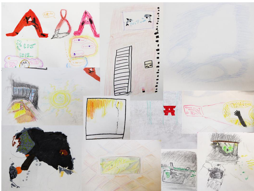
みんなで描いたスケッチのコラージュ