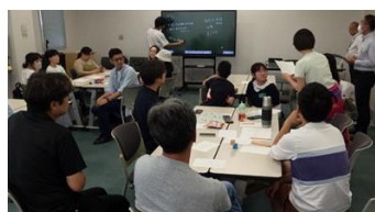
会場の様子(左:野々市、右:珠洲)

6月~9月にかけて、金沢方面、珠洲市内、オンラインで計5回開催し、77名が参加しました。1回目は「自分や家族がどう過ごしたいか」「これからの珠洲市のために何に取り組むか」について、2回目は「子ども・教育」をテーマとして「珠洲の学校教育で大切にしたいこと」などを議論しました。