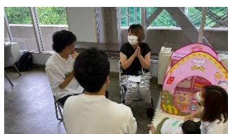
お子連れれの参加者も