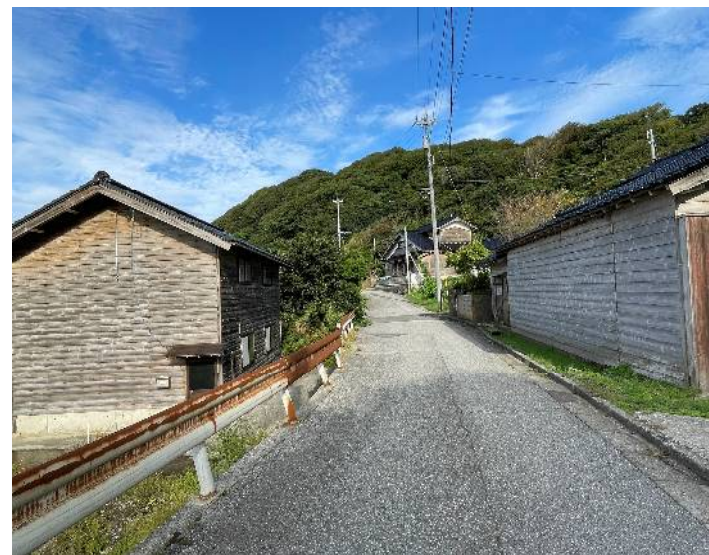
日本海の絶景が広がる高屋町に立地