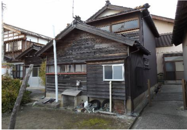
飯田町の海岸近くに立地