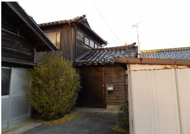
商店街まで徒歩圏内です