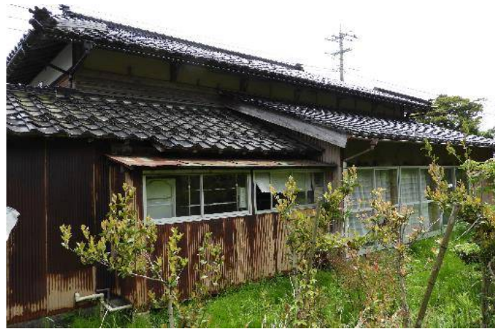
小泊地区に立地、海岸の近くです