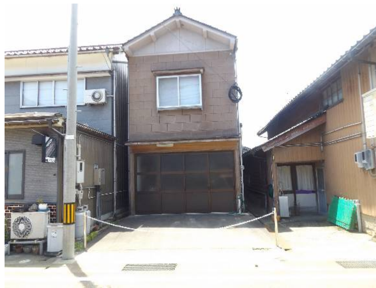
正院町の中心街の県道沿いに立地